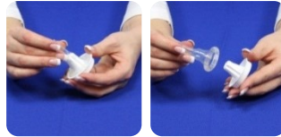
Style 2 und 3