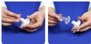
Style 2 und 3

Ouvrez l'emballage au niveau de la perforation, retirez l'étui pénien au niveau de la sortie en forme d'entonnoir.